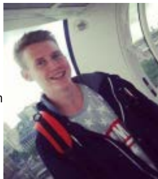
und das gesamte Jugendteam